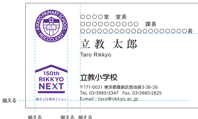
立教小学校 / 裏面