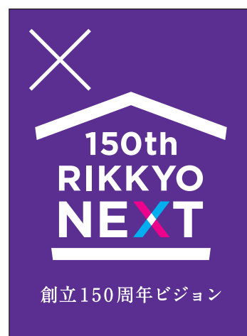
反転させて使用してはいけません