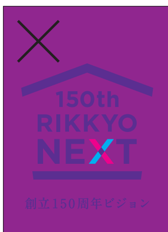
背景とのコントラストが弱く視認性に 欠けてはいけません