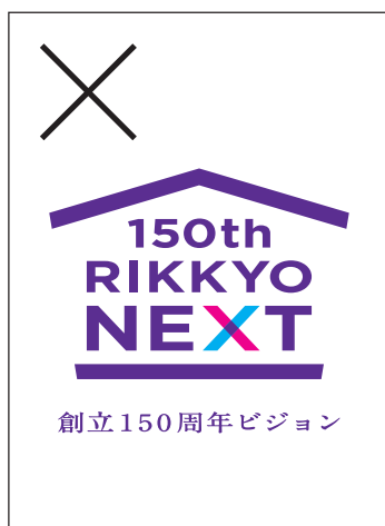
ロゴを変形させてはいけません

「RIKKYO NEXT」ロゴを適切に表示するため、ここにあげた禁止例に留意し、的確に使用してください。