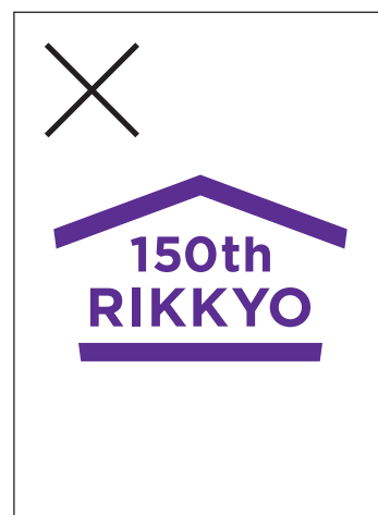
構成要素を省略削除してはいけません