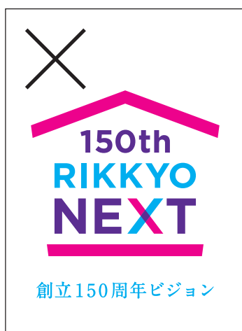
色を変えてはいけません