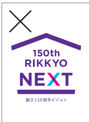
要素のバランスを変えてはいけません