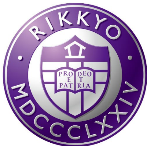
立体表現 / 立教学院