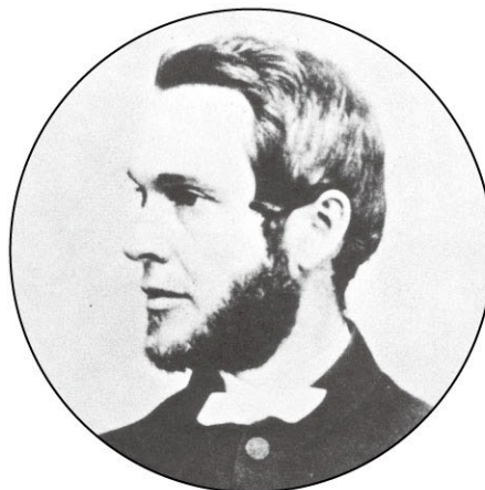
モノクロ写真表現