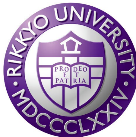
立体表現 / 立教大学