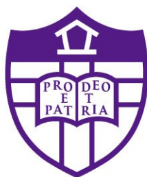
シールドマークのみ