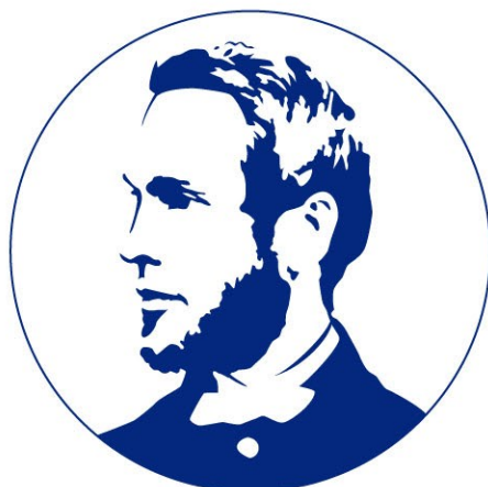
ハイコントラスト表現